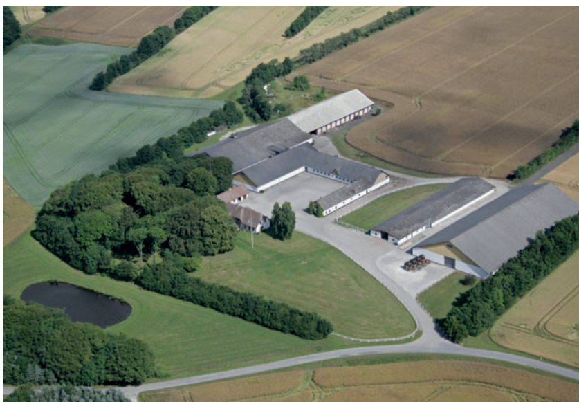
Sindholt i Ajstrup, luftfoto.

Da vi købte gården, var der 40 køer, og også grise, men da jeg var overfølsom for ammoniak, satte vi dyrene ud og gik i stedet for i gang med at købe og forpagte jord. Det var jo også der min interesse lå, så det var vi indstillet på i forvejen.