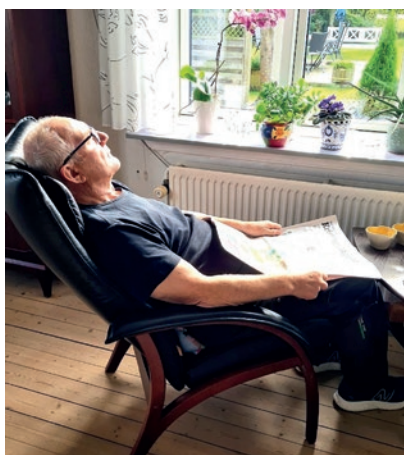
Tid til hvil.

Det er en dag midt i august. Jeg sidder i den bedste af vores lænestole, en solstråle kommer ind gennem vinduet, og jeg mærker varmen på min venstre skulder forplanter sig ned gennem hele kroppen. Jeg har lige spist frokost,