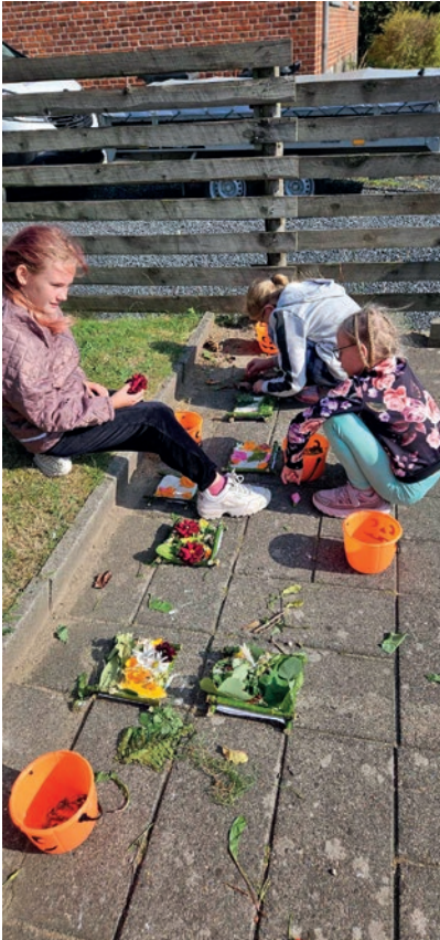
Billeder af naturmaterialer.

Så det blev til sunde drikke og mellemmåltider til børnene.