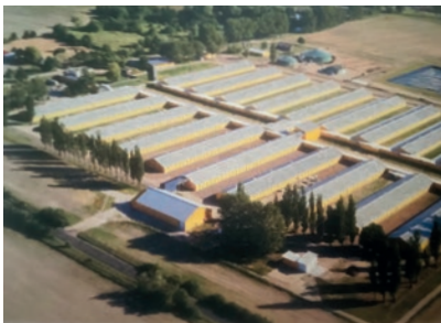
Luftfoto af farmen i Polen.

Det skulle måske være, at jeg i 1993 var med til at starte et landbrugsprojekt op i Polen med markbrug og grise. Jeg sad i bestyrelsen for markbruget, og andre tog sig af grisene. Det er det største landbrugsprojekt, der er i Polen. Det hedder "Goodvalley". I 2003 startede vi også op i Ukraine, og et par år efter i Rusland.