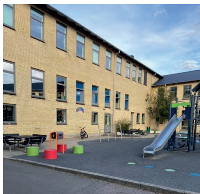
Gymnastiksalen - før ombygningen.

For at sikre, at alt gik rigtigt for sig, og at eleverne lærte det, de skulle, var der tilsyn af et par sognerådsmedlemmer og den lokale præst en gang om året. Der var to grunde til, at jeg husker et ganske bestemt tilsyn. For det første var vores bedstefar (farfar) en del af tilsynet, fordi han sad i sognerådet. For det andet var jeg blevet udvalgt til at skulle fremsige et salmevers. Jeg havde øvet flittigt og vidste, at jeg kunne stå distancen. Men da den alvorstunge stund oprandt, og jeg blev bedt om at rejse mig, gik snakketøjet fuldstændig i baglås. Jeg forsøgte og forsøgte at få tungen på gлед, men salmeversets smukke ord ville ikke frem. Jeg husker selv situationen som særdeles akavet og pinlig. Til sidst forbarmede læreren sig og sagde, at jeg gerne måtte sætte mig. Hvis sognerådsmedlemmerne skulle skrive en tilsynsrapport efter besøget, blev der uden tvivl lavet en anmærkning omkring lærerens forsømmelse af indlæring af salmevers i den pågældende klasse.