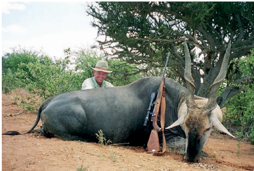
Fra en af jagturene til Sydafrika, hvor jeg fik nedlagt en Eland.

Man må sige, at det har været noget at en oplevelsestur, vi har været på i den her snak. Og jeg har været rigtig godt underholdt. Hvis man vil vide mere omkring projekterne i Ukraine og Polen kan man prøve at google "Goodvalley".