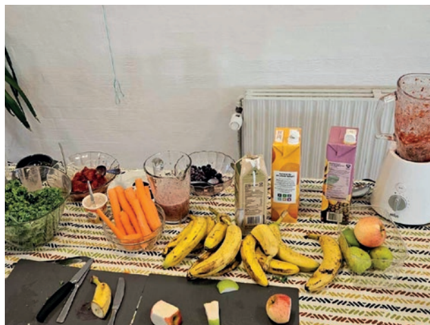
Hvad skal der være i smoothien.