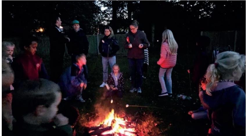
Hygge ved bålet.

Weekenden sluttede med en familiegudstjeneste. Her var kirken fyldt af glade børn, forældre og øvrige kirkegængere. Børnene havde til anledningen øvet en sang. Maj fortalte bibel-