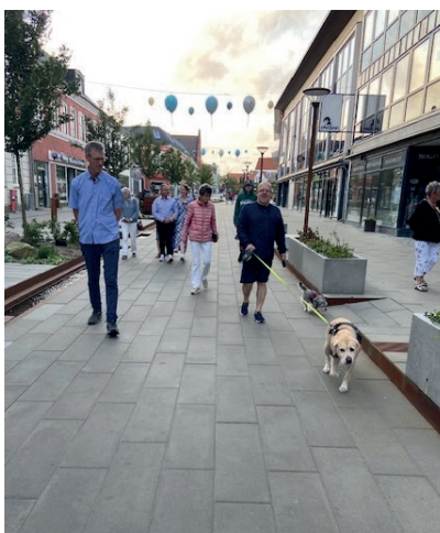
Gågaden i Hjørring.

I juli var vi på besøg i et privat hjem i Hjørring. Her gik vi først en tur gennem Hjørrings centrum, hvor vi fulgte det nyanlagte klimasikrede vandløb gennem gågaden og videre ad Jernbanegade til Mammutpladsen. Både flot og nyttigt i forhold til klimaforandringerne med mere forventet nedbør.