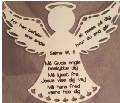
En lille engel til at tage med hjem.

Børnemedarbejderne i Tylstrup Frikirke tænkte, det må vi som kirke kunne gøre noget med. Så midt i alt "uhyggen" må der også være noget trygt og godt. Kirkens budskab er netop, at dele evangeliet om Jesus – "Det glade budskab"! Halloween-aften delte Tylstrup Frikirke derfor slik ud til alle de børn, der var ude og lave "slik eller ballade". Inde i kirkens forhal kunne dem der havde lyst desuden få en engel med en velsignelse og tænde et lys. For lys får som bekendt mørket til at forsvinde.