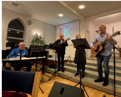
Lovsanggruppen leder i sang.

Så var der selve juleaftensgudstjenesten, med en flot pyntet kirke, hvor alle børn hver fik en lille gave. Atter var det en fyldt kirke, der var samlet til en dejlig julegudstjeneste. Udover julesalmer og prædiken kunne man glæde sig over at lytte til et par dejlige soloer, inden man kunne vende hjem og nyde, at julefreden kunne indfinde sig.