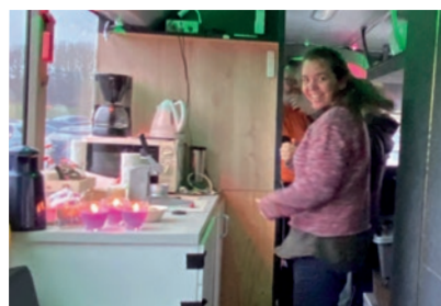
Klar til en let servering.

Bussen har mange funktioner og muligheder, så temaet i forbindelse med besøget var selvfølgelig advent og jul – samt den bibelske fortælling om hvorfor vi holder jul. Så der er måske nogle i Tylstrup og omegn, der har fået en julegave lavet i bussens julegaveværksted.