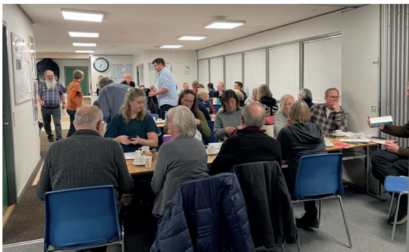
Fra mødet d. 23. januar.