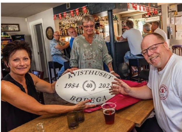
Vi er meget glade for denne flotte plade som vi fik i gave af Kvisthusets Venner, i anledningen af jubilæet.

Nu her hvor jeg sidder og skriver artiklen, sker det flere gange at Osvold Helmuths skønne sang "Hen om hjørnet og ned i kælderens" dukker op i ens tanker. Det er godt, at vi her i Tylstrup har et sted som "Kvisthuset". Et sted hvor man kan gå hen og hygge sig, og møder andre mennesker. Lige som man også kan Idrætsforeningen og Kirken m.fl. alt efter hvad ens behov er.