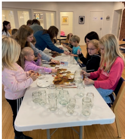
Aktiviteter til familiegudstjenesten.

Men det der gjaldt for 2000 år siden gælder også i dag. At være en kirke der viser omsorg for den enkelte. Derfor er en af kirkens styrker, at vi udvikler og vedligeholder relationer og fællesskaber.