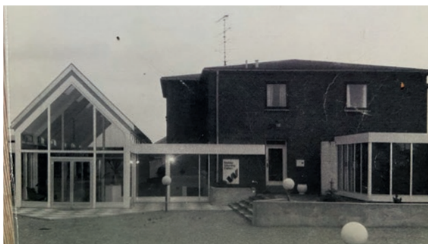
Fra bogen lokalhistorie i Ajstrup sogn.