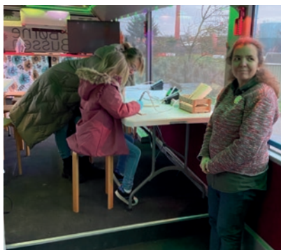
Mulighed for aktiviteter i bussen.

Børnebussen er en del af Evangelisk Frikirkens børne- og ungdomsafdeling.