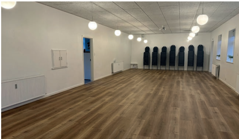
Det nye gulv.