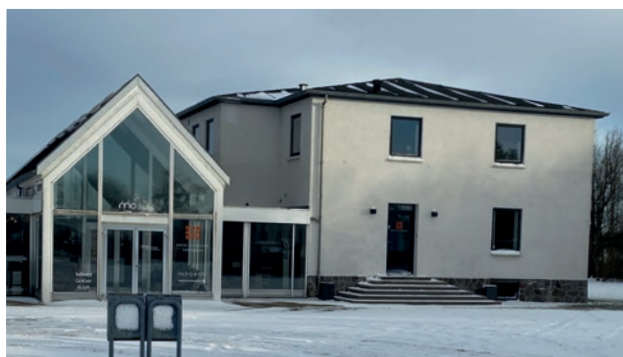
Vævegården i dag.