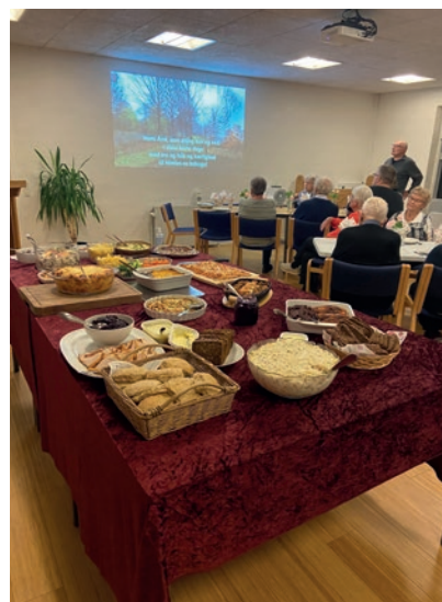
Så er maden serveret til fællesspisningen.

Fredag d. 15. nov. var der spise sammen aften i Tylstrup Frikirke. Der var ingen egentlig program, men mulighed for hygge, god tid og skønt fællesskab. Her kom vi selv med maden, som blev sat på et stort bord, og så var det ellers at forsyne sig af de mange forskellige retter. Aftenen sluttede med en kop kaffe med kage til. Inden vi sagde tak for i aften, blev der sunget en aften-sang og bedt Fadervor.