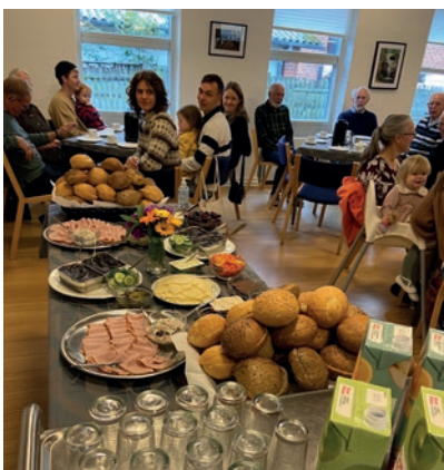
Klar til cafégudstjenesten.

Efter gudstjenesten var der udvidet kirkekaffe, hvilket vil sige, at der bl.a. blev serveret popcorn og andre dejlige ting, til glæde for både børn og voksne.