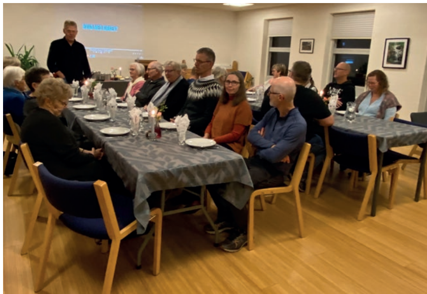
Klar til Alpha.

Tirsdag d. 28. januar begynder Tylstrup Frikirke med at vise serien "The Chosen". Vi begynder kl. 19.00 med at vise et afsnit, som efterfølgende drøftes over en kop kaffe og et stykke kage. Det hele varer ca. 1½ time og vil fortsætte hver anden tirsdag foreløbig frem til sommerferien. Det hele er gratis – så mød gerne op, og bliv klogere på hvad kristendom er, set gennem filmatiseringen af Bibelens 4 evangelier.