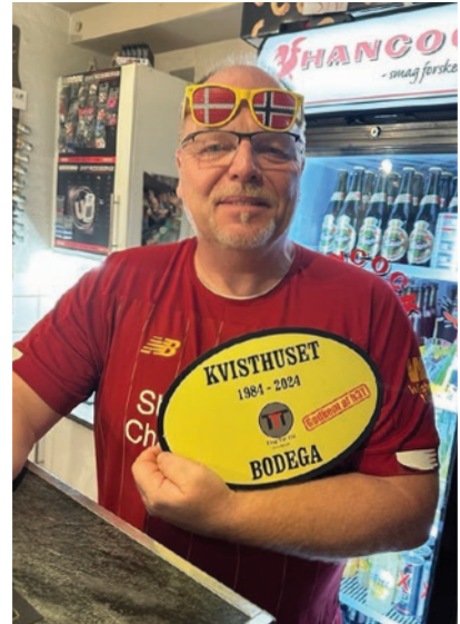
Gaven fra det norske cykelhold er vi også meget glade for.